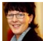
EN LANDSHÖVDING TALAR UT Nedgång blev uppgång Sidan 3